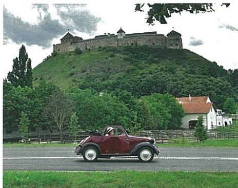
A sümegi vár mindenhez jó háttérrel nyújt

T agadhatatlan (és most bocsássa meg mindenkinek az elfogultságomat), hogy régen volt Magyarországon ilyen színvonalú nemzetközi oldtimer márkatalálkozó, mint a 37. International Topolino Meeting Sümegen.