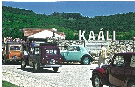
Viszlát, Professor! Köszönjük a vendéglátást!