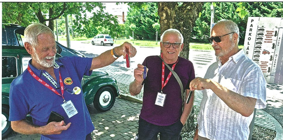
Nincsen svájci svájci bicska nélkül. Itt a méret nem számít

Nagyon vártam már június 14-ét, előző nap bepakoltam mindent a Topolinóba, hogy másnap reggel nyolckor csikorgó kerekekkel kilőhessek Sümegre. A topolinózás olyan, mint a Tisza Szegednél, lassú, ha nem szórakoztatod magad, akkor eseménytelen. Amikor kalandos veteránórázásra gondolok, nem a szerelés a jut eszembe, sokkal inkább a szép táj, kedves emberek, jó kaják. A tervem az volt, hogy a legrövidebb helyett kellően kacskaringós úton jutok el Pomáztól a célig, amennyire lehet, csak dombos-erdős tájakon. Az útvonal Pomáz-Piliscsaba-Zsámbék-Felcsút-