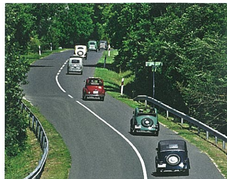
Halad a világ legcukibb konvoja

Nem minden Fiat, ami Topolino, tartja az ősi talján bölcsesség, mert bizony a Fiat nem a Zsigulinál kezdte a teljes gyártósorok licen-