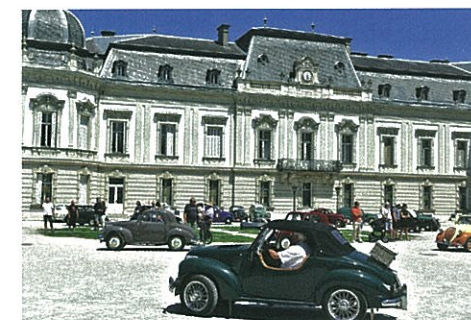
Indulunk a kastélyból!

Az olaszok mikiegere pedig tényleg az egyik legszerethetőbb veterán, erre újra és újra rájövök. ●