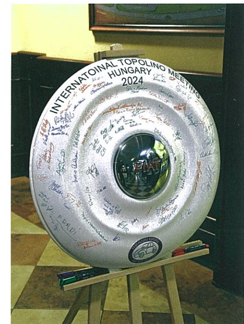
Mindenki aláírta a pótkerék fedelét