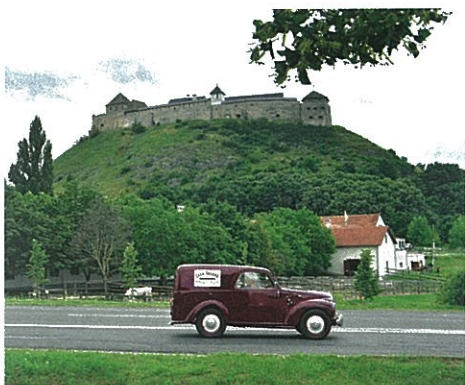
A kenyereskocsi nagyon menő!