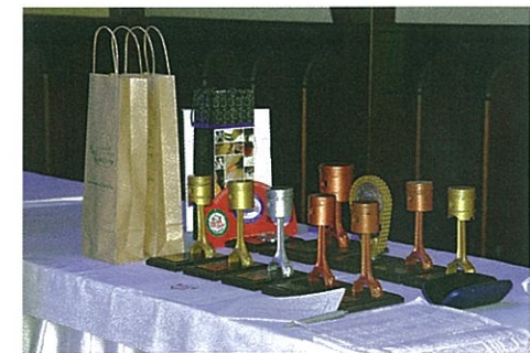
Díjak Topolino dugattyúból és hajtórúdból készítve