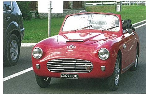
A-TYA-ÉGI! Topolino Ferrari árban!

vő motor hangja, ami semmiben nem emlékeztetett az ismert autóra a garázsomból. Mondom az ott bámészkodó svájciaknak, hogy ez bizony egy Topolino, mire ők, hogy hülye vagyok, és nem értek hozzá, amíg oda nem sodródtak a járgányhoz. Az arcukra volt minden írva, én meg csendben ünnepeltem pirruszi diadalomat.