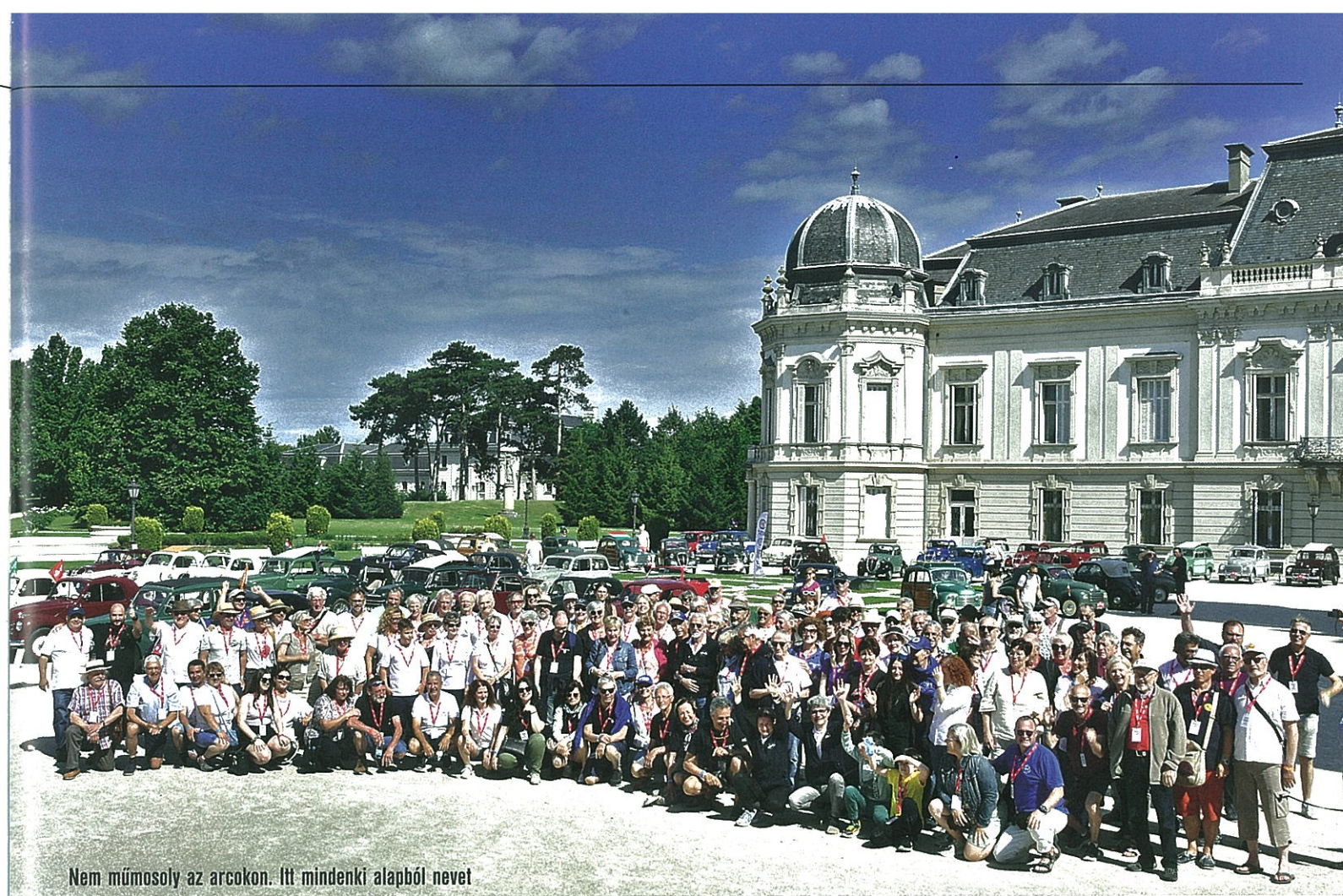
Nem műmosoly az arcokon. Itt mindenki alaphőzettel!

Végül mindenki befutott időben, én tettem egy-egy rövid kört a két legérdekesebb autóval, majd csinibe vágtuk magunkat, és jött a gálavacsora a díkjiosztóval. Megünnepeztük az újabb együttlétet, a 2025-ös találkozó szervezői mindenkit szeretettel meghívtak Zürichbe, a legvégén pedig hamisítatlan retró diszkóval zártuk az estét. A hetvenes,